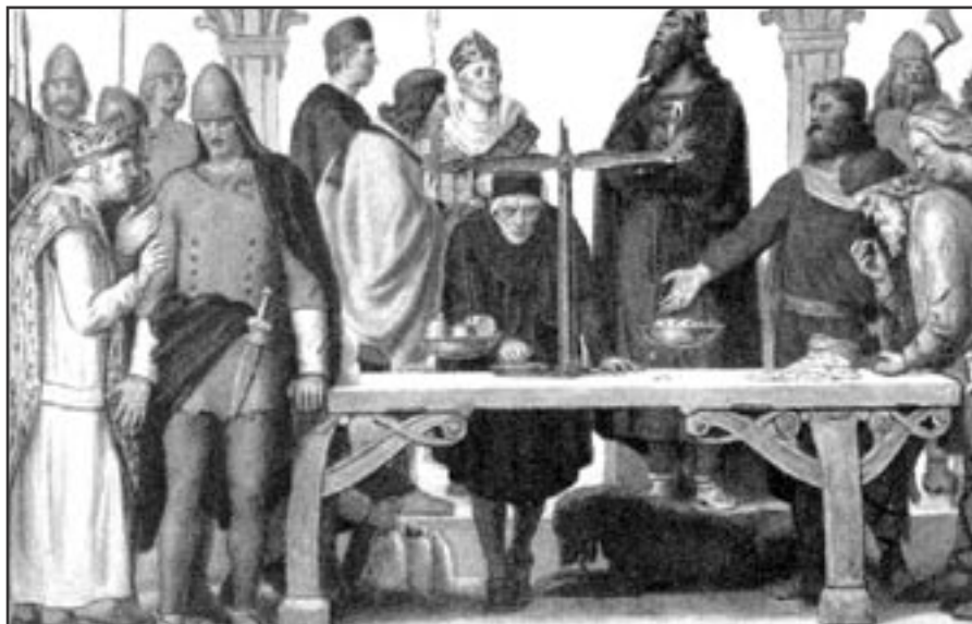
Tiden er ved at være kommet, hvor vores og ledelsens forslag skal vejes og måles.

Psykiatrilædelserne har uddelegeret forhandlingskompetencen til den enkelte afdelingsledelse, så fremover skal alle forhandlinger ske direkte med den relevante afdelingsledelse.